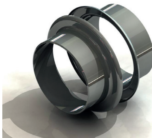
M-LENS profil s vysokou vlnou zváraný vo vrchnej časti vlny

Kompenzátory typu M-LENS sa používajú v aplikáciách na výmeníkoch tepla, vysokých peciach a ich potrubných kanáloch.